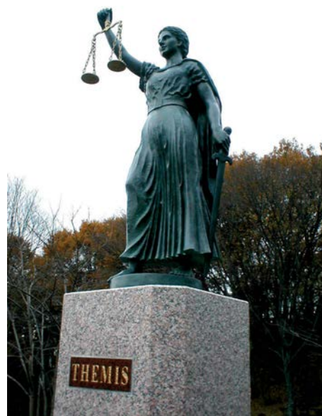
VEĆINA DOKUMENATA SU MRTVO SLOVO NA PAPIRU: Temida, grčka boginja prava i pravde

U junu 2010. godine usvojen je Posebni protokol Ministarstva zdravlja Republike Srbije za zaštitu i postupanje sa ženama koje su izložene nasilju. Posebni protokol je instrument za prepoznavanje, evidentiranje i dokumentovanje rodno zasnovanog nasilja, sa ciljem da se zdravstveni radnici/e uključe i reaguju na planu otkrivanja, suzbijanja